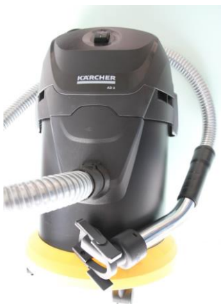
ASPIRA POLVERE CONSIGLIATTO Kärcher AD3

Per ritirare la bocca, stringere le due braccia e fare uscire uno dei ganci, poi in rotazione, l'altro gancio